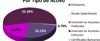
Por Tipo de Activo