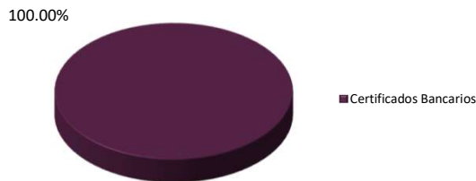
Por Tipo de Activo