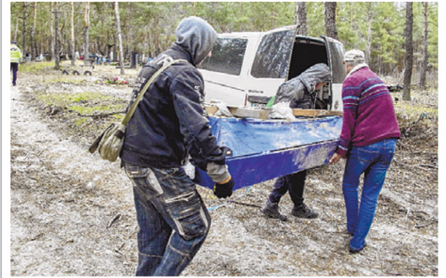
Exhuma cadáver en el cementerio de Izyum, Ucrania.