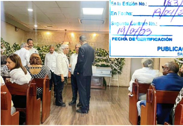
Familiares de Heredia reciben pésame en la funeraria.