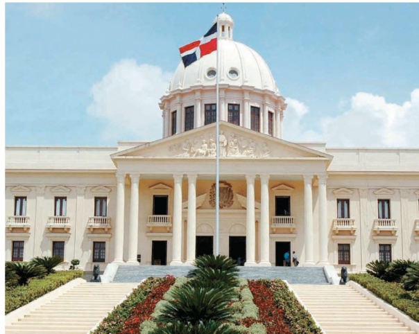
Palacio Nacional, sede del Poder Ejecutivo.

las restricciones son a partir de las 7:00 de la noche, también con tres horas adicionales de circulación (libre tránsito está hasta las