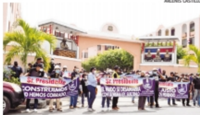
Los contratistas llevan 7 y 5 años esperando les paguen por servicios.

Sin embargo, adujo que los ingenieros se pasaron del monto permitido por peticiones del MinerD. Además expresó que las autoridades les pagaron a muchos contratistas que al igual que ellos se pasaron