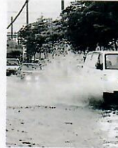
Vaticinio de esta tarde es lluvias.

Las temperaturas serán ligeramente calurosas durante el día y frescas en la noche y la madrugada, en especial hacia zonas de montañas. Estará la máxima