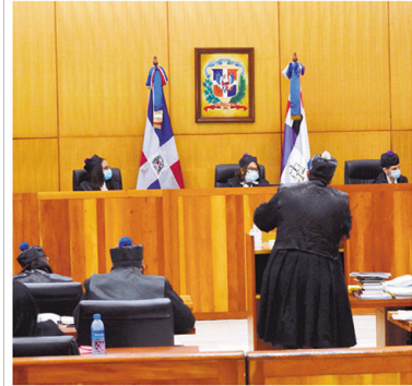
Continuación del caso Odebrecht.