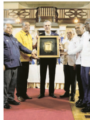
Reconocen al Presidente

"Hay un tema también que ustedes tienen desde hace mucho tiempo y que es un dolor de cabeza y una molestia para muchos, y yo