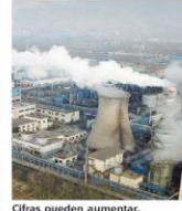
Cifras pueden aumentar.

Registradas en 732 ciudades de 1991 a 2018