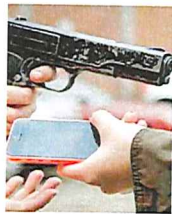
Asaltos no dan tregua.

"Asaltan con pistolas y armas blancas a las personas que salen a trabajar