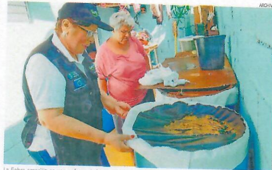
La fiebre amarilla es una enfermedad transmitida por el mismo mosquito que transmite el dengue.

Síntomas. Las principales manifestaciones de esta enfermedad son la fiebre y el color amarillento de la piel y la conjuntiva, de ahí viene el nombre de fiebre amarilla.