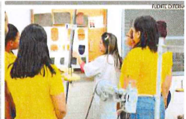
Parte de los técnicos dominicanos que viajaron a China.